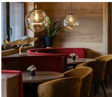
RoCo-Bar: für das verdiente Feierabend-Bierchen